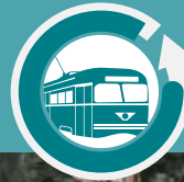
Plantel 2 Cien Metros "Elisa Acuña Rossetti"