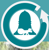
Plantel 1 El Rosario